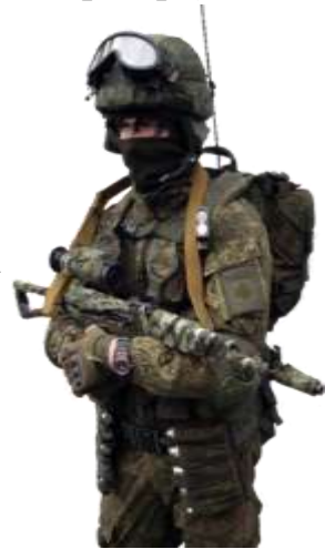
Гражданин, пребывающий в запасе